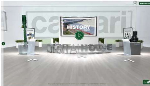
Caprari Digital House

CAPRARI DIGITAL HOUSE è la risposta del Gruppo a un momento storico in cui, a causa del Covid-19, sono in atto grandi cambiamenti nel modo in cui si vive e si lavora. Cambiamenti che hanno spinto in maniera forte il Gruppo CAPRARI a cogliere l'opportunità di realizzare un innovativo stand virtuale, online dal 16 febbraio .