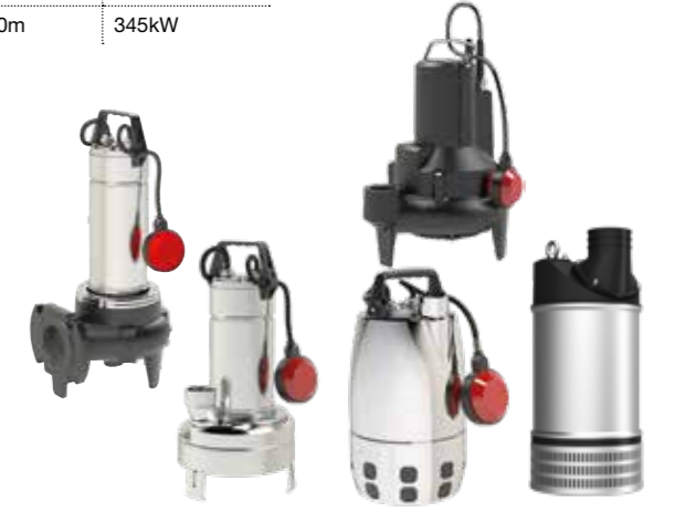
Tauchpumpen für Entwässerung und Abwasser