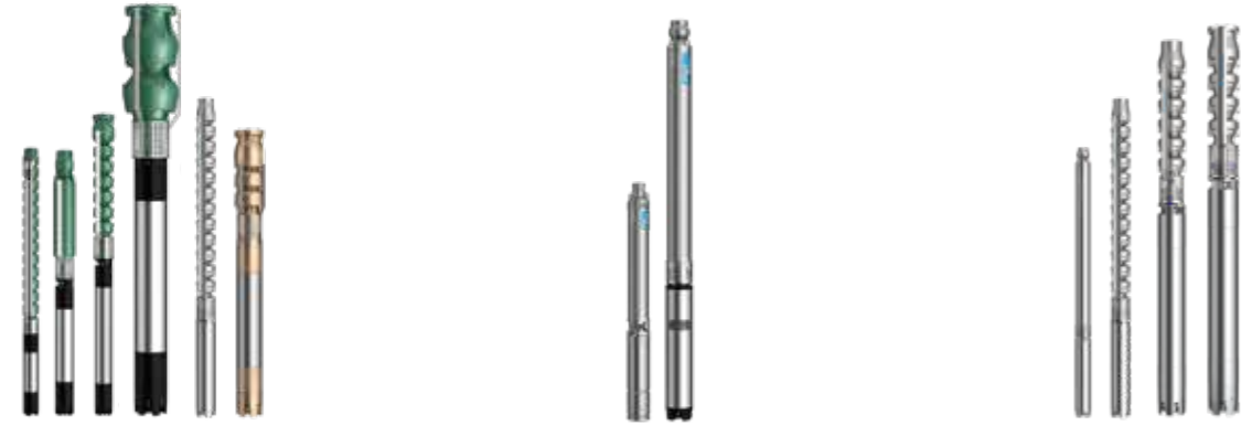
6" ÷ 22" Tauchpumpen aus Gusseisen und Bronze, Edelstahl, Duplex und Super-Duplex