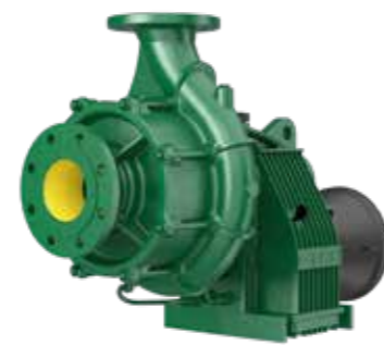
Verfahrbare Pumpen für Traktoren