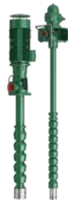
6" ÷ 22" Pumpen mit Vertikalachse