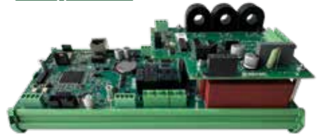
GREEN BOX Control and monitoring system