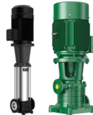
Vertikale mehrstufige Pumpen