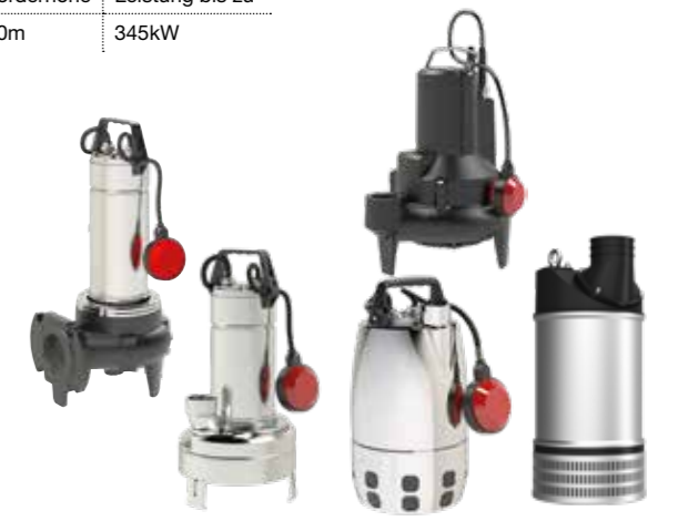
Tauchpumpen für Entwässerung und Abwasser