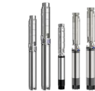
6" ÷ 10" Tauchpumpen Aus Gestanztem Stahl