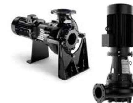
Pumpen Mit Oberflächenmotor